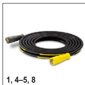
1, 4-5, 8